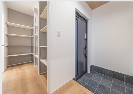
玄関周りの豊富な収納