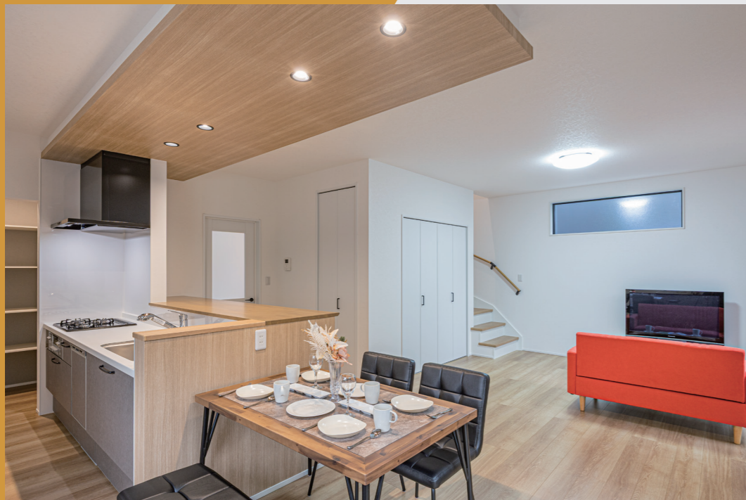
LDK キッチン・ダイニング上部の木張りのアクセント天井が上質な雰囲気を演出します。