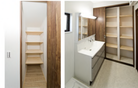
1階ホール収納 洗面所の収納